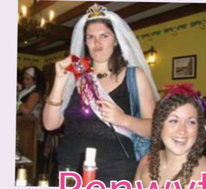
Rachel yn hardd fel priodferch!